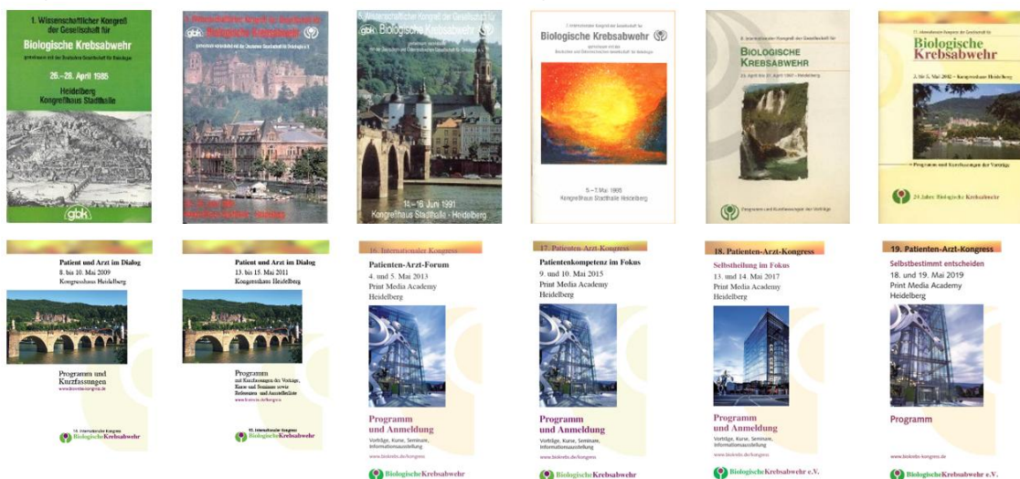
GfBK-Kongressprogramme aus vielen Jahren

Große Veranstaltungen gab es seit Bestehen der GfBK-Beratungsstelle Wiesbaden auch dort, sehr gut besuchte Arzt-Patienten-Foren fanden ca. alle zwei Jahre statt. Weitere Veranstaltungen (Halbtages- oder Tagesveranstaltungen) sowie zahlreiche Vortragsabende, Kurse und Seminare informieren über Bewährtes und Neues aus der komplementären Krebsmedizin. Hierzu haben die Mitarbeiterinnen der regionalen GfBK-Beratungsstellen umfangreiche Jahresprogramme ins Leben gerufen und organisieren seit 2021 auch viele online-Veranstaltungen. Von 2010 bis 2021 wurde in Kooperation mit der Akademie im LEBEN Greiz die Fachfortbildung Integrative Biologische Krebsmedizin einmal jährlich veranstaltet, die aufgrund der Corona-Pandemie leider seither ausgesetzt blieb.