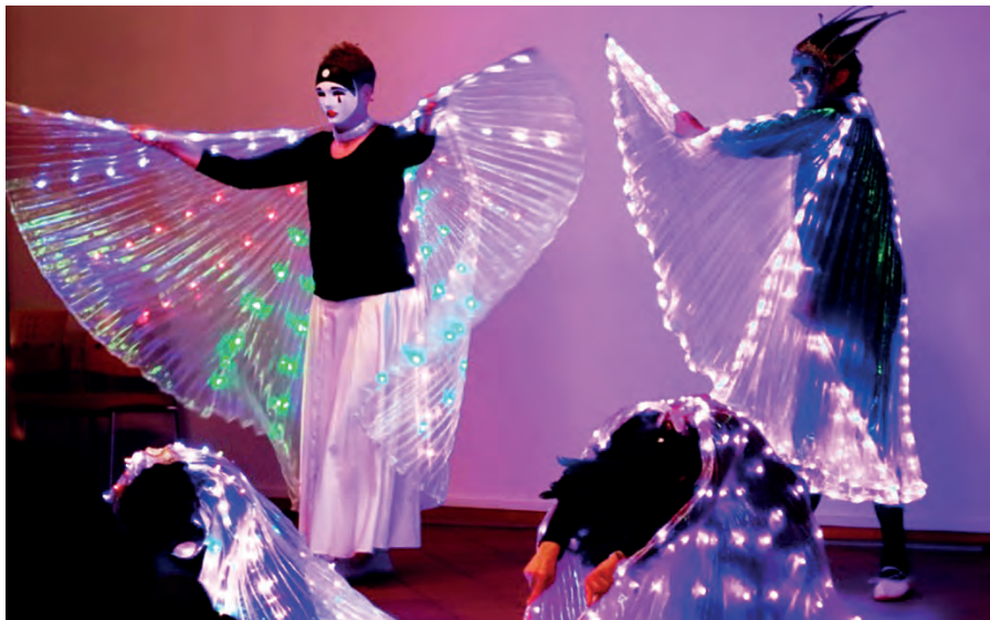
Mit Isis-Wings heilsame Langsamkeit erleben.

All diesen Methoden als Basis dient die Erfahrung, dass Bewegung sichtbar gemachter Atem ist. Atem ist Leben, Atem ist Bewusstsein. Obgleich ich sowohl im