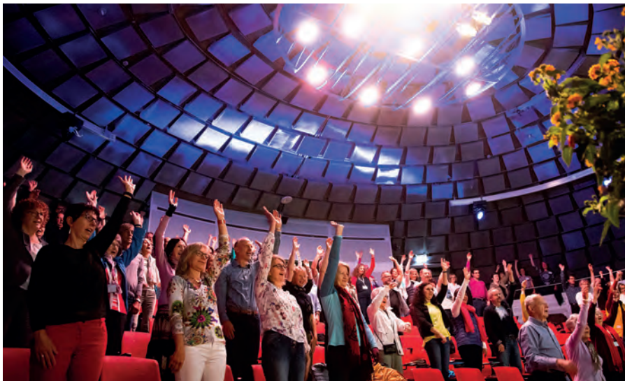
Der Kongress in der Print Media Academy war gut besucht.