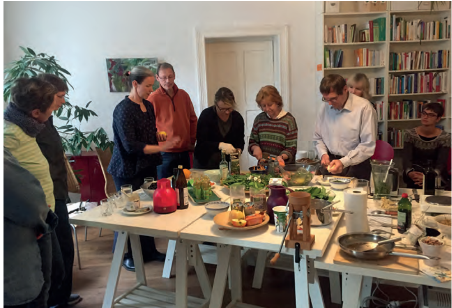
In Berlin fand ein Ernährungsworkshop statt.