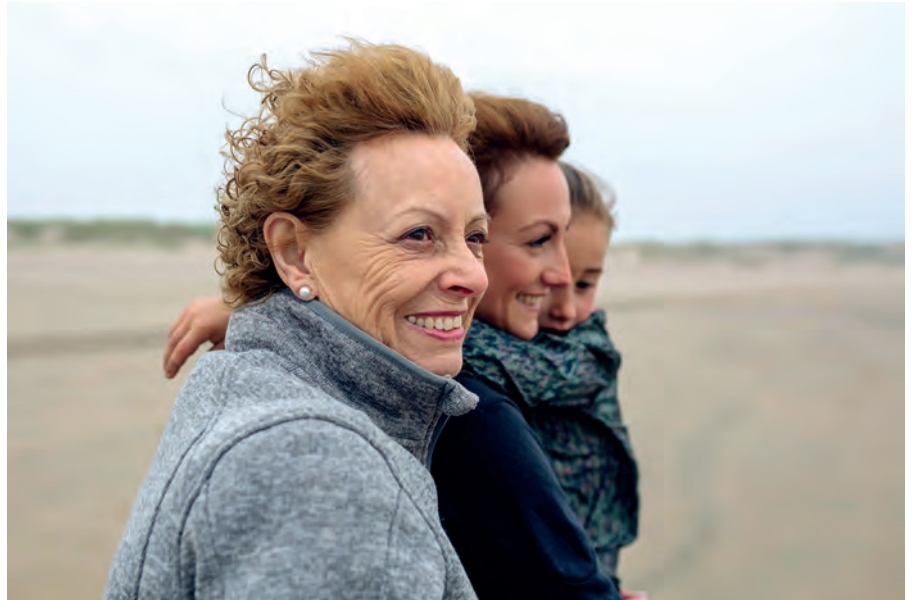
Auch die Gesundheit der Familie gibt Hinweise. Symbolbild