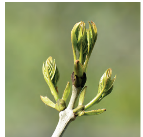
Nach der germanischen Mythologie soll der Mensch aus der Welteneiche hervorgegangen sein.

und Rheuma schmerzlindernd und regenerierend wirkt. Diese Pflanze, die als niederliegender oder aufrechter Baum erscheint, ist so biegsam, dass winterliche Lawinen über sie hinwegrollen, ohne ihr großen Schaden zuzufügen. Entsprechend verhilft ihr Knospenextrakt den arthrotisch veränderten Gelenken zu mehr Beweglichkeit. Am deutlichsten ist ihre Wirkung an den großen Gelenken (Schulter, Hüfte und Knie) spürbar. Selbstverständlich profitieren auch die kleinen Gelenke. Die Bergföhre hilft, dass kleinere Schäden am Gelenkknorpel wieder repariert und remineralisiert werden. Davon kann auch die Wirbelsäule profitieren: Die osteoporotischen Veränderungen können aufgehalten und somit kann den gefürchteten, äußerst schmerzhaften Wirbelfrakturen vorgebeugt werden. Bei den entzündlichen rheumatischen Erkrankungen hilft die Bergföhre auch beim Heilen der entzündeten Sehnen- und Bandansätze. Doch wird dem Patien-