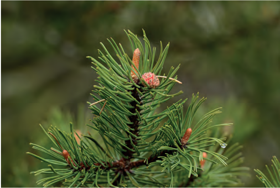
Die Bergföhre ist biegsam und anpassungsfähig.

ten Geduld abverlangt, damit das Knospenmittel seine Wirkung entfalten kann.