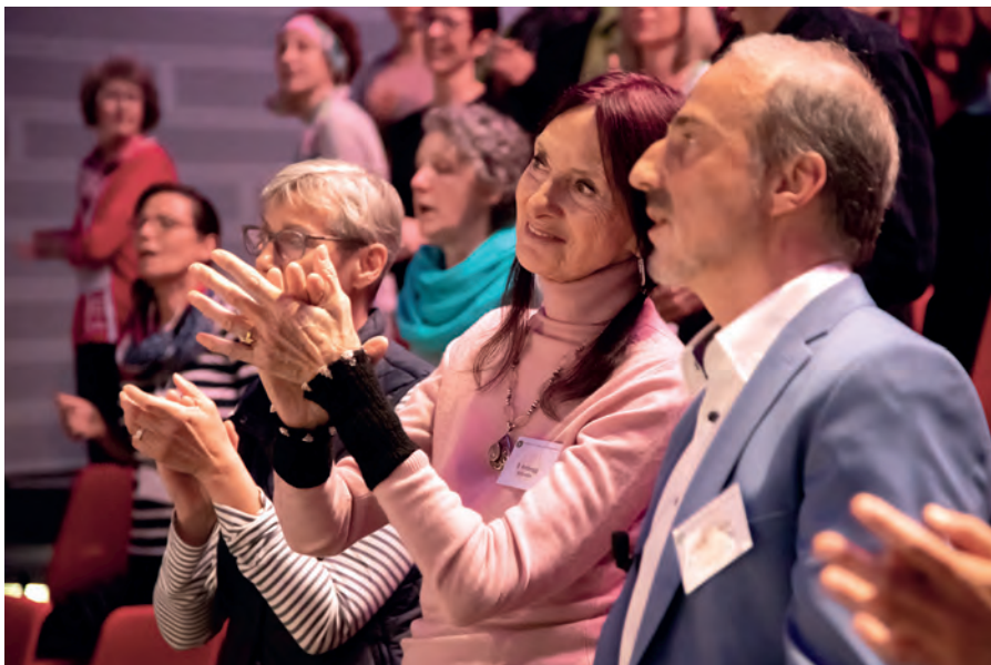
Der GfBK-Kongress gab wertvolle Impulse.