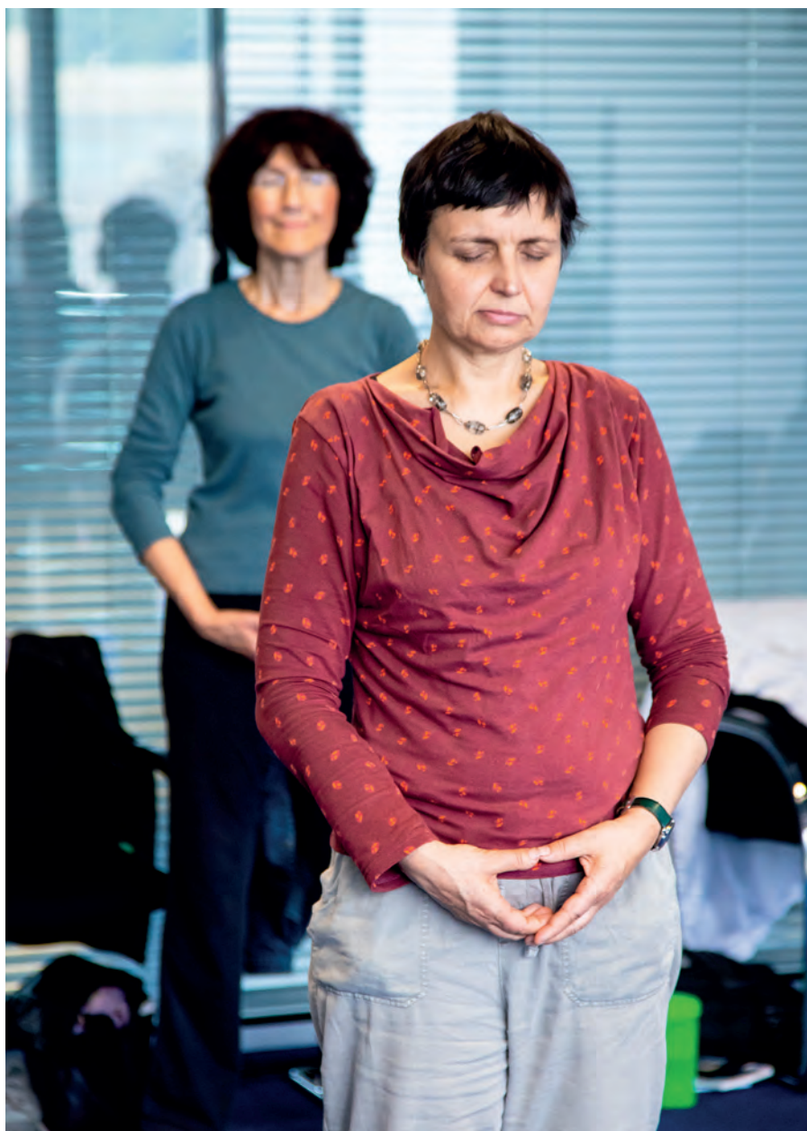
Qigong Übende beim GfBK-Kongress in Heidelberg.

nimmst“, werden die vorher nicht gespürten Anspannungen und Ungleichgewichte im Körper bewusst. Im zweiten Schritt kann der bzw. die Übende eine angenehme Spannung und Aufrichtung finden. Ich bin hier in diesem Moment, und so fühlt sich mein Körper genau in diesem Augenblick an. Eine solche Erfahrung