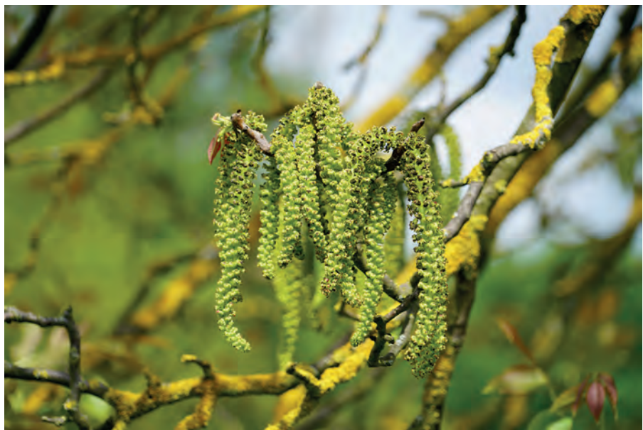
Die Bachblüte Walnut dient der Narbenentstörung.

Die Paläo-Diät, auch als Steinzeit-Diät bekannt, geht von der Theorie aus, dass sich unser Verdauungsapparat an den Wechsel zur Ackerbaugesellschaft vor 20.000 Jahren nicht angepasst hat. Einen Beleg, der diese These stützt, gibt es nicht. Vielmehr weist einiges darauf hin, dass wir uns im Laufe der Evolution so gut durchsetzen konnten, weil der Mensch in Sachen Ernährung so flexibel und anpassungsfähig ist. Außerdem weiß niemand mit Gewissheit, was die Steinzeitmenschen tatsächlich gegessen haben. Wahrscheinlich haben sie sich als Allesfresser stark an die regionalen Nahrungsvorkommen angepasst, um zu überleben. Vermutlich gab es Stämme, die vorwiegend vegetarisch gegessen und andere, die eher Fisch verzehrt haben. Eine einheitliche Ernährung in der Steinzeit beschreiben zu wollen, ist vermessen. Manche Funde aus der Steinzeit weisen auf eine fleischreiche Kost hin. Pflanzen, Früchte, Nüsse und Samen sowie Insekten und Würmer waren mutmaßlich die Hauptbestandteile