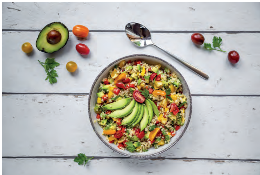
Eine gesunde Ernährung bringt den Darm in Schwung.

bolite ist nur bei postmenopausalen Frauen sinnvoll. Vereinzelt findet man zwar Berichte in der Literatur, dass auch vor den Wechseljahren ein Zusammenhang festgestellt werden kann. Allerdings ist die Datenlage nicht eindeutig. In größeren Studien wurde keine Assoziation bei prämenopausalen Studienteilnehmerinnen gefunden.