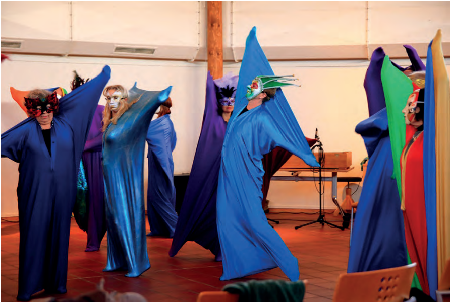
Der Tanzsack fördert die Beweglichkeit auf allen Ebenen.

üben. Auch Arthrosepatient*innen können sich generell wieder besser bewegen, wenn sie diese Gelenke trainieren.