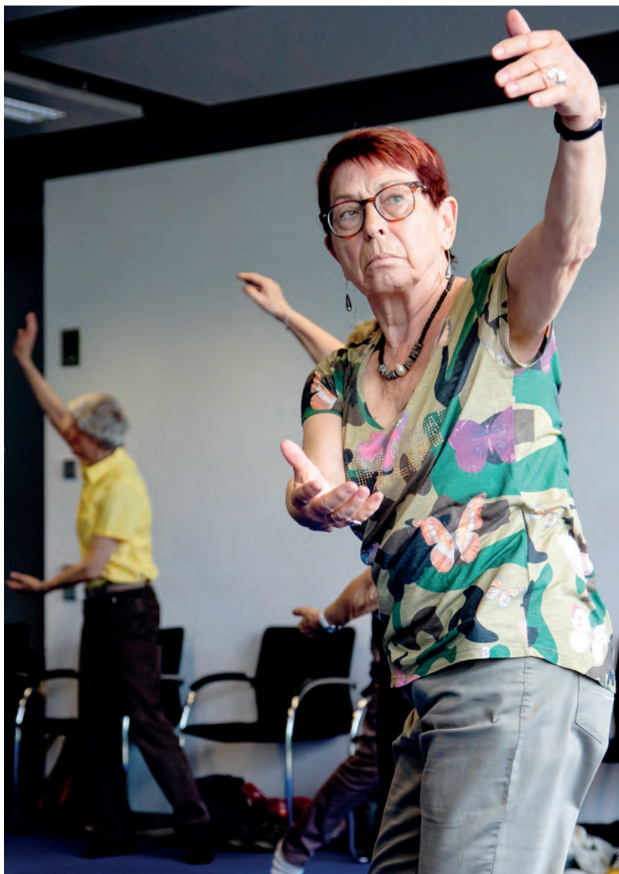
Achtsame Konzentration auf die Bewegung.

nen so angelegt sein, dass eine äußere Regungslosigkeit im Sitzen oder Liegen mit Vorstellungsbildern kombiniert wird, die das Qi (Lebensenergie) im Inneren des Körpers zirkulieren lassen. Im stillen Körper findet dann eine innere Bewegung statt.