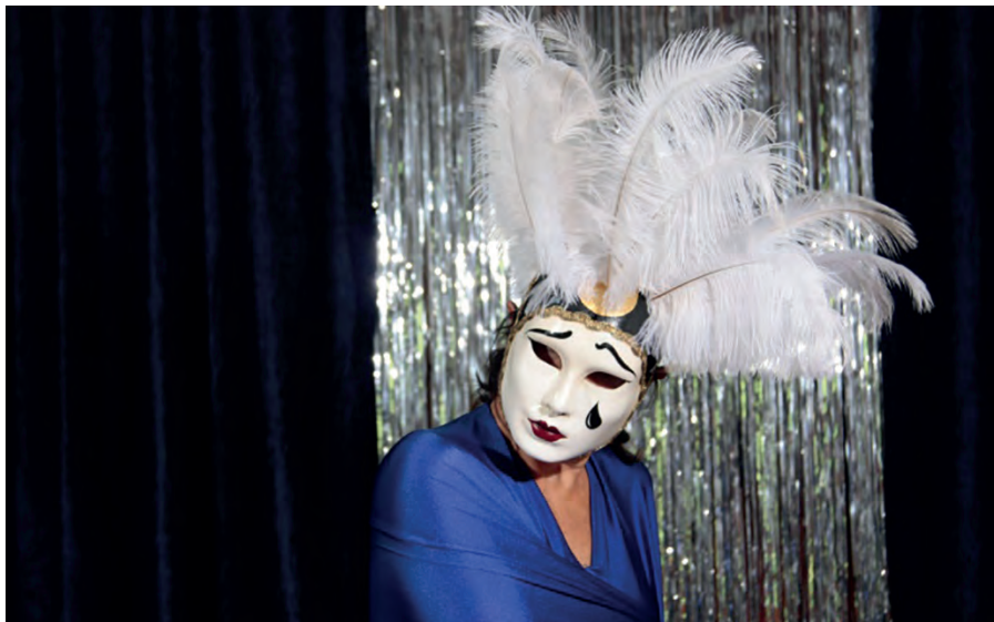
Die Maske dient dem Anonymisieren.

gar gestresst sind, zeigen unsere Handgelenke eine eingeschränkte Beweglichkeit, wie wir sie sonst in Zusammenhang mit Demenz kennen: Wir können die Handgelenke nicht mehr flüssig, schnell und locker umeinander drehen. Umgekehrt fangen Demenzkranke plötzlich wieder an zu sprechen, wenn sie solche Bewegungen