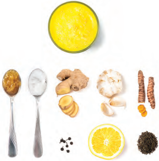
Zutaten mit heilsamer Wirkung: Kurkuma-Shot.

Zubereitung. Kurkuma, Ingwer und Knoblauch schälen und mit den restlichen Zutaten in den Mixerbehälter füllen. Entweder den Saft einer halben Zitrone auspressen oder je nach Geschmack eine viertel ungespritzte Bio-Zitrone mit Schale in den Mixer geben. Abhängig von der gewünschten Konsistenz noch etwas Wasser hinzufügen. Um den Shot geschmacklich etwas milder zu machen, kann optional noch eine halbe Orange, ohne Schale, beigegeben werden (Achtung: Fruchtzucker!).